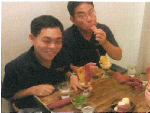
取引先であるカフェ「蜜香屋」におじゃましてきました！