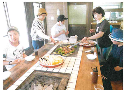
リサイクルグループはひよしフォレストリゾート山の家でバーベキューを満喫!!