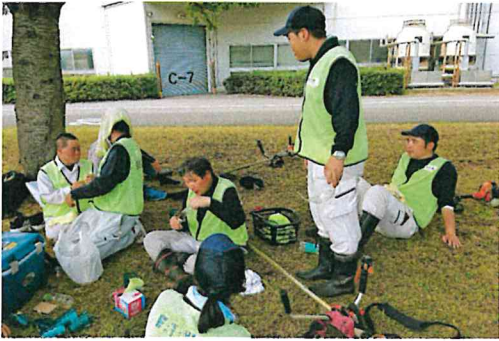
連日の暑さにバテ気味の外勤メンバー。アイスの差し入れでほっこり。