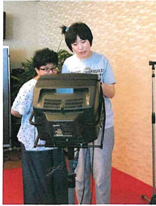
玉川楼さんで夏のごくろうさん会を開催!! カラオケを楽しみました!!