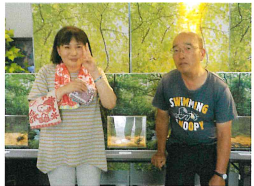
月曜のさんぽで「世界のクワガタ展」を見に行きました！色んなクワガタがいたよ！