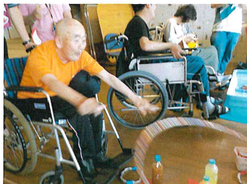
夏祭りをしました！射的(写真左)や輪投げ(写真右)をして楽しみました！