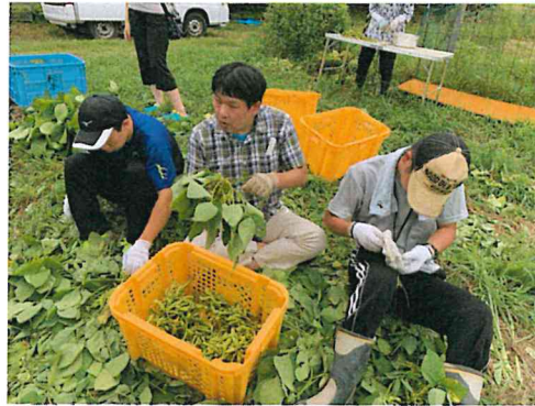
8月22日から丹波篠山で始まった枝豆収穫の作業です。 暑い中、もくもくと作業に励んでいます!!