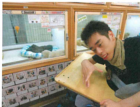
グループさわさわのごくろうさん会はイオンモールへお出かけしました!