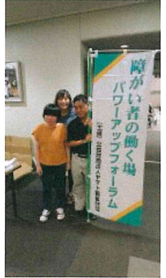
「ヤマトパワーアップフォーラム」で登壇し発表をしてきました！