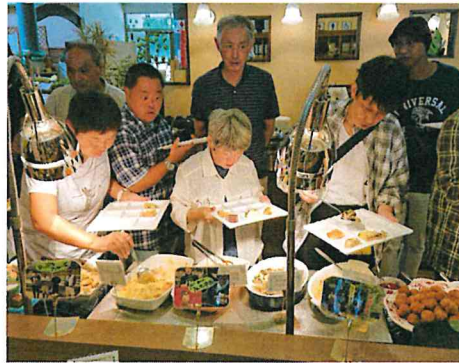
ごくろうさん会で「リフレ かやの里」に行ってきました。