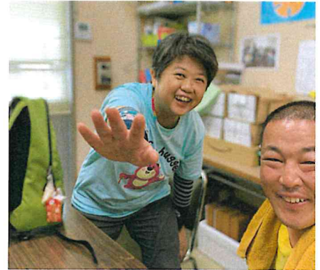
京都・じねんと市場へ 納品に行ってきます!!