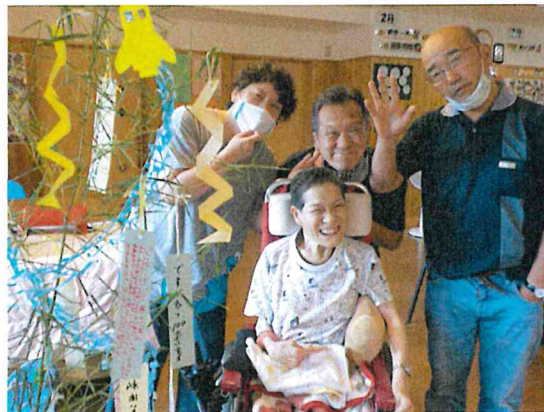
願い事をたくさん書いて、飾り付けもバッチリ！叶うといいですね！