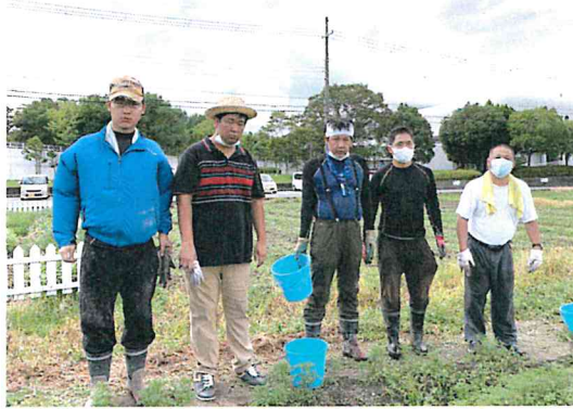
8月からコスモス園の美化作業が 始まりました。暑い〜!