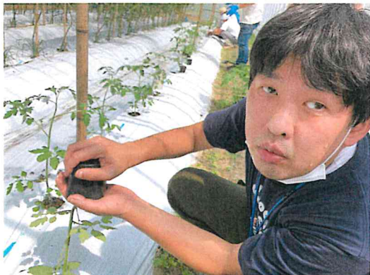
チャレンジアグリ研修でトマトの苗付けを勉強中!