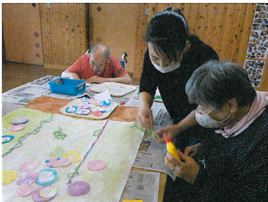
夏の壁絵は朝顔！一生懸命作った花が、色とりどりに咲いています。