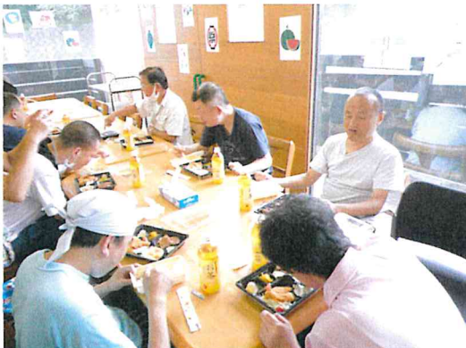
みんなで特製お弁当を食べました!