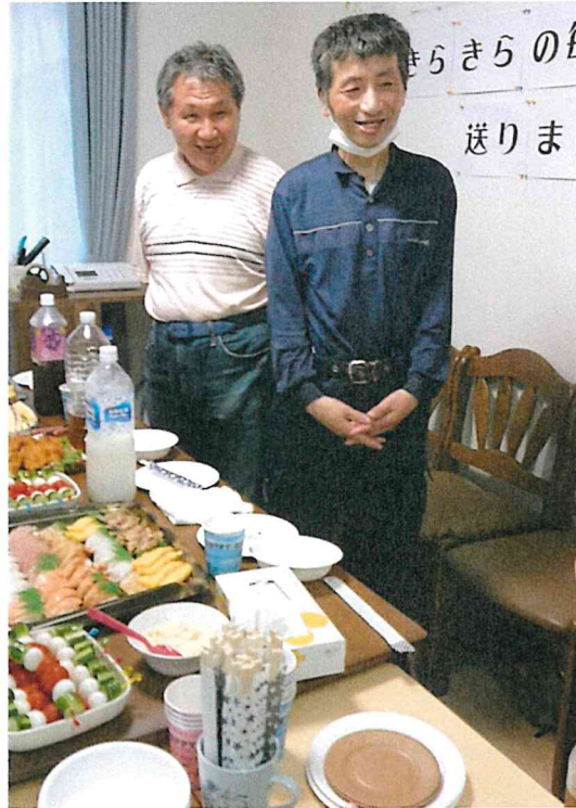
きらきらホームに入居したメンバー2人。「一人暮らしは大変や～」と言いつつ、とても嬉しそう。