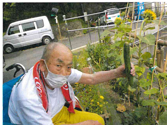
みんなで育てた夏野菜。立派なきゅうりが採れました！