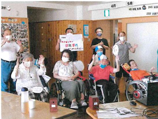
北海道から鹿児島まで、きょうされんの仲間と一緒になかまくん音頭を踊りました！