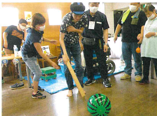
最後はみんなでスイカ割り!ゴムボールを叩 いた後はみんなで本物のスイカを食べました!