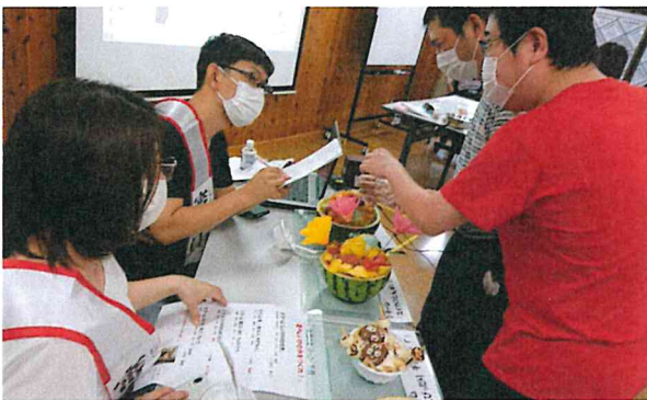
7月のミッション「夏らしいかき氷をつくれ！」暑い夏にぴったり、思い思いの「夏らしい(見栄え)」「おいしい(味)」「おもしろい(オリジナリティ)」かき氷をつくりました。