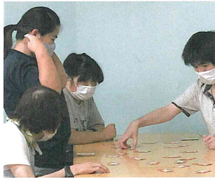
2020夏ごろうさん会・食事会の後、 トランプを楽しみました。