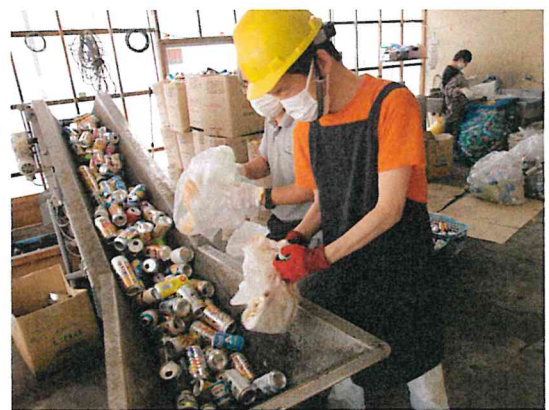
ボーナスに向けて毎日がんばります！↑↓