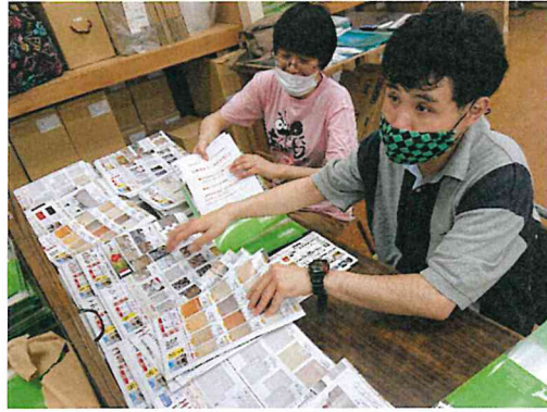
ダイレクトメール作業をがんばっています！