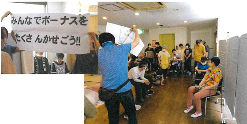
ボーナス取り組みスタートの日。出陣式をして気合十分！