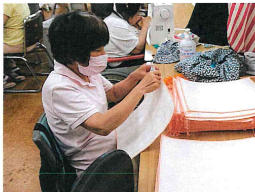
クラフトグループはふきん作りに大忙し！