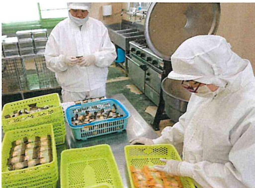
あられ缶入れ作業は部屋も暑くなってきましたが、がんばっています！