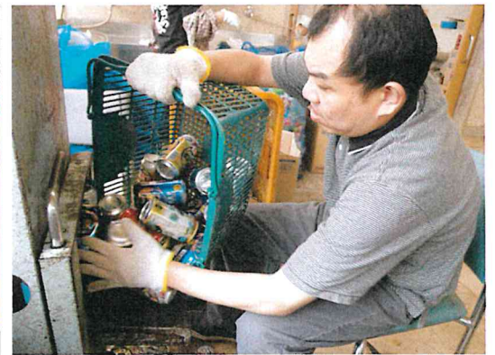
お給料取り組みは作業所内で感染防止に配慮しながら楽しんでいます！