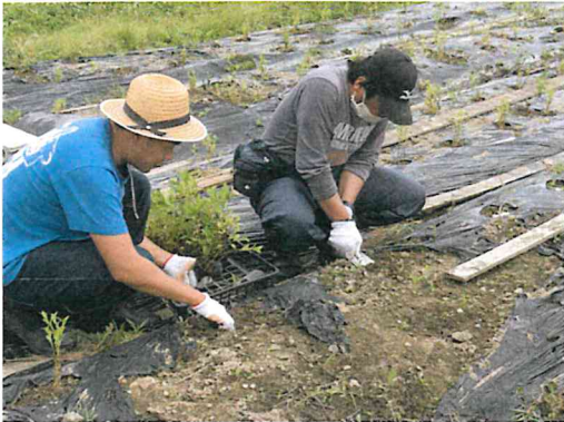
保津の藍の畑作業、どんどん始まります！