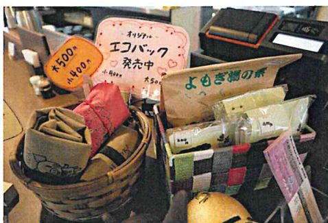
レジの前に作業所製品が置いてあります

調べていく中で作業所の存在を知り、飛び込みでお話しに伺いました。地域の方との関係を作ることで、何かしら地域に還元できれば、みんなの良い方向に向かえばよいなと思いました。