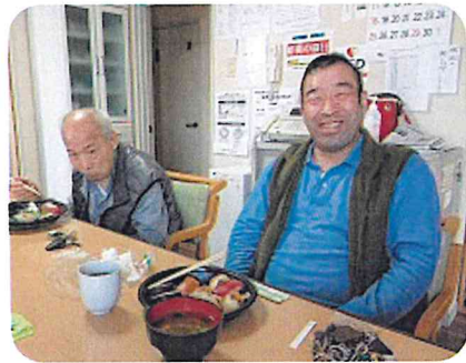
ホームだけのこ ちよつと豪華なお弁当