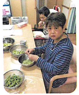
ホームひまわり 誕生会の準備中