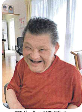
誕生会で還暦の お祝いに満面の笑み