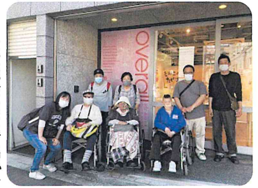
over all展を見に行きました

のポスターを見て決める人など様々です。グループホームに入居して、初めて期日前投票に行かれたメンバーもおられました。まだまだ、障害のある人にとつて選挙が身近で分かりやすく投票しやすい環境ではありませんが、投票所足を運ぶことによつて、少しずつ制度や環境が整備されることを願っています。