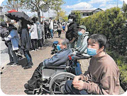
光秀まつりを見学しました

休日の余暇の過ごし方は工夫が必要です。コロナ禍で外出する機会も少なくなり、休日はホームで過ごす時間が増えました。そのような中でも、一人ひとりが主人公になれる取り組みを計画して日々の暮らしの中に豊かさを取り入れています。誕生会や季節の行事、長期休暇には遠出したり、ちよつと豪華なお弁当を食べて、ゆつくりお話したり、ほっこりできる時間は