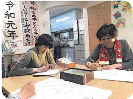
ホームひまわり誕生会の前に創作活動中

日々の暮らしの中で丁寧な一人ひとりの願いを聞き取り、実現していくことは簡単なことではありませんが、グループホームがメンバー一人ひとりにとつて居心地のよい場所であること、みんなとワイワイできるお楽しみがあることが明日もがんばろうにつながっていれば良いと思います。